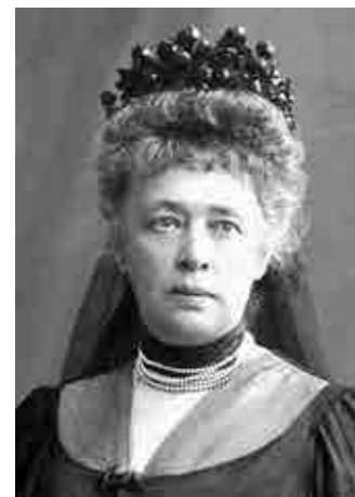
Bertha von Suttner